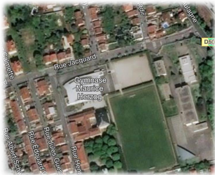
Gymnase Maurice Herzog

Station Gare d'Oullins (terminus) / Station Part-Dieu (Gare SNCF toutes lignes) en Métro B :