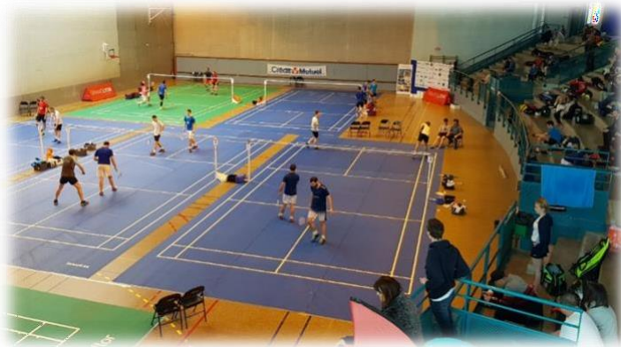
Gymnase Maurice Herzog