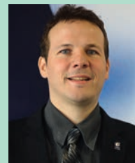
Pierre Emmanuel Panier, le plus jeune dirigeant masculin de la FFBaD

Elles accueillent les jeunes de 5 à 17 ans dans des créneaux spécifiques par âge et par niveau. L'encadrement des séances est assuré par des éducateurs diplômés et de plus en plus professionnalisés. Il existe plus de 1000 EFB en France, réparties selon différents niveaux de labellisation qui s'échelonnent de 1 à 5 étoiles selon des critères fixés par la FFBaD.